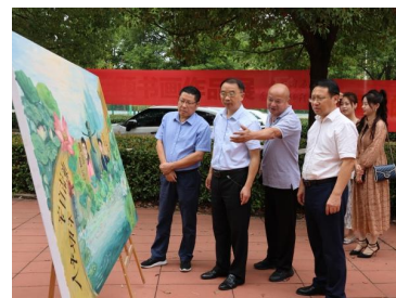
▲校领导在活动现场查看

据悉，本次展览旨在通过师生喜闻乐见的形式，将廉洁文化引进校园，深入下去，助推学校廉政教育建设，营造积极向上的氛围，弘扬时代主旋律。